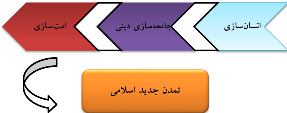
شکل ۲. نقش انتظار انقلابی در تحقق تمدن جدید اسلامی